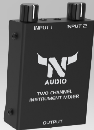
N-audio Two channel instrument mixer